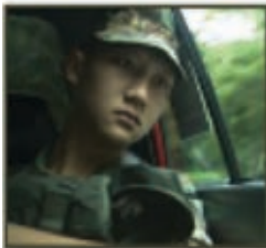
FONG XIONGKUN ARMY BOY

Born in Malaysia, Yann Yann has been acting in Singapore since the late 90s. A pioneer-graduate of the Theatre Training and Research Programme, she has worked in theatre, television, and film; notable performances include Singapore Dreaming , theatre production Thunderstorm and an upcoming movie 881 . Yann Yann is represented by Fly Entertainment.