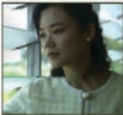
YEO YANN YANN YOUNGEST DAUGHTER