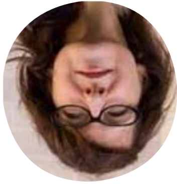
Ursula Meier (Suisse)

Remarquée pour ses courts métrages, Ursula Meier tourne en 2002 pour Arte le superbe téléfilm DES EPAULES SOLIDES . Son premier long métrage, HOME , avec Isabelle Huppert et Olivier Gourmet, reçoit en 2009 le César du Meilleur Premier Film. Il est suivi en 2012 de L'ENFANT D'EN HAUT , film surprenant récompensé d'un Ours d'argent au Festival de Berlin.