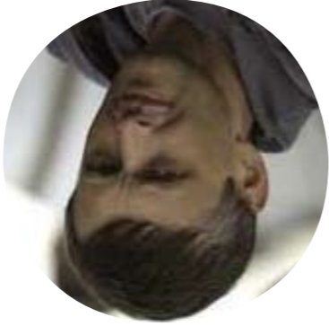
Sergei Loznitsa (Ukraine)

Sergei Loznitsa a réalisé de nombreux documentaires dont LA STATION, remarqué par la critique. Son premier long métrage, MY JOY, odyssée sombre et virtuose dans la Russie contemporaine, a été sélectionné en compétition officielle au Festival de Cannes en 2010. Son impressionnant film de guerre, DANS LA BRUME, également en compétition à Cannes, a reçu le prix FIPRESCI de la critique internationale en 2012. Son documentaire MAIDAN est également présenté par le Festival en 2014.