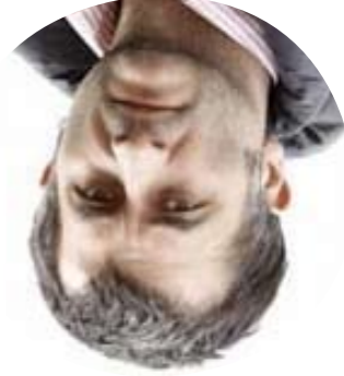
Cristi Puiu (Roumanie)

Après avoir réalisé un premier long métrage à 21 ans, LE CIEL MONTE, Marc Recha est remarqué pour son film L'ARBRE AUX CERISES, qui remporte le prix FIPRESCI au Festival de Locarno. Sa notoriété s'accroît avec le film PAU ET SON FRERE, présenté en compétition au Festival de Cannes en 2001. LES MAINS VIDES avec Olivier Gourmet et Eduardo Noriega, est présentée au Festival de Cannes dans la section Un Certain Regard en 2004