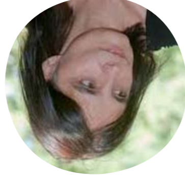
Teresa Villaverde (Portugal)

Son premier long métrage, LE MATOS ET LA THUNE, est sélectionné à la Quinzaine des réalisateurs, où il remporte plusieurs prix dont le prix FIPRESCI de la critique internationale. Trois années plus tard, il est couronné d'un Ours d'Or à Berlin pour son court métrage UNE CARTOUCHE DE KENT ET UN PAQUET DE CAFE. Il décide peu après de se lancer dans la réalisation de six films sur la banlieue de Bucarest. Le premier volet de ce vaste projet, LA MORT DE DANTE LAZARESCU obtient, entre autres, le prix Un Certain Regard au Festival de Cannes. En 2010, Cristi Puiu réalise AURORA le deuxième volet de sa saga sur sa ville natale, également présentée à Cannes.