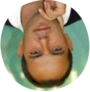
Vincenzo Marra (Italie)

Son premier long-métrage, ORDINARY PEOPLE , film saisissant sur la guerre et la banalité du mal, a été sélectionné par la Semaine Internationale de la Critique en 2009. Il fait partie d'une nouvelle génération de réalisateurs serbes remarqués pour leur écriture moderne et leur approche singulière de l'histoire de la Serbie.