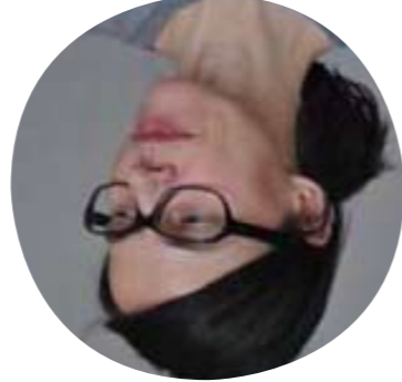
Angela Schanelec (Allemagne)

Née à Lisbonne en 1966, Teresa Villaverde est remarquée dès son premier film, A IDADE MAIOR réalisé en 1990. Elle rencontre une reconnaissance internationale en 1998 avec le film OS MUTANTES. En 2006, son cinquième film, TRANSE, est sélectionné à la Quinzaine des réalisateurs.