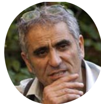
Leonardo Di Costanzo (Italy)

Born in Sarajevo, Aida Begić grew up in the midst of the Yugoslavian war and has made it one of the main subjects of her works. After several shorts, and a number of advertising films, she shot her first feature film, SNOW, which won the 2008 Critics' Week Grand Prix at Cannes. In Cannes in 2012, her film DJECA, CHILDREN OF SARAJEVO, received a Special Mention from the Un Certain Regard jury.