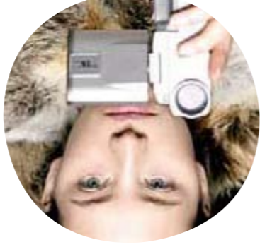
Isild Le Besco (France)

Sergei Loznitsa a réalisé de nombreux documentaires dont LA STATION, remarqué par la critique. Son premier long métrage, MY JOY, odyssée sombre et virtuose dans la Russie contemporaine, a été sélectionné en compétition officielle au Festival de Cannes en 2010. Son impressionnant film de guerre, DANS LA BRUME, également en compétition à Cannes, a reçu le prix FIPRESCI de la critique internationale en 2012. Son documentaire MAIDAN est également présenté par le Festival en 2014.